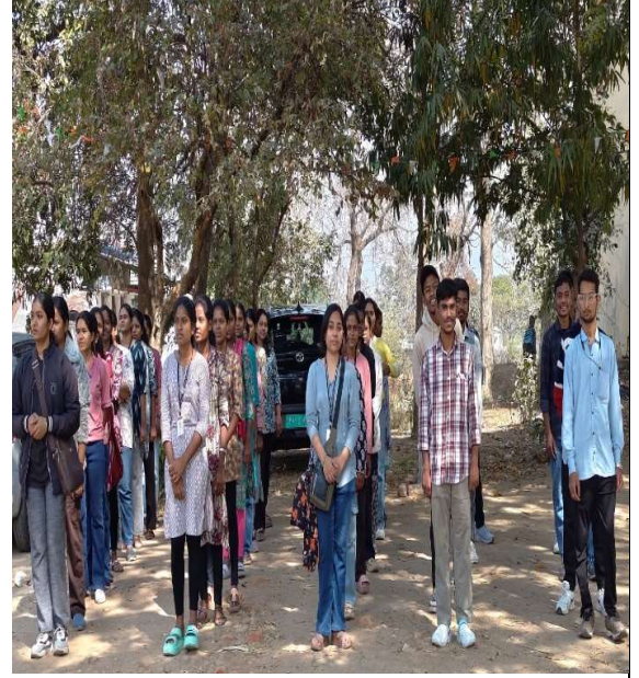
ग्रामीण शिबीरात रासेयो ध्वज वंदना करतांना रासेयो कार्यक्रम अधिकारी आणि शिबिरार्थी