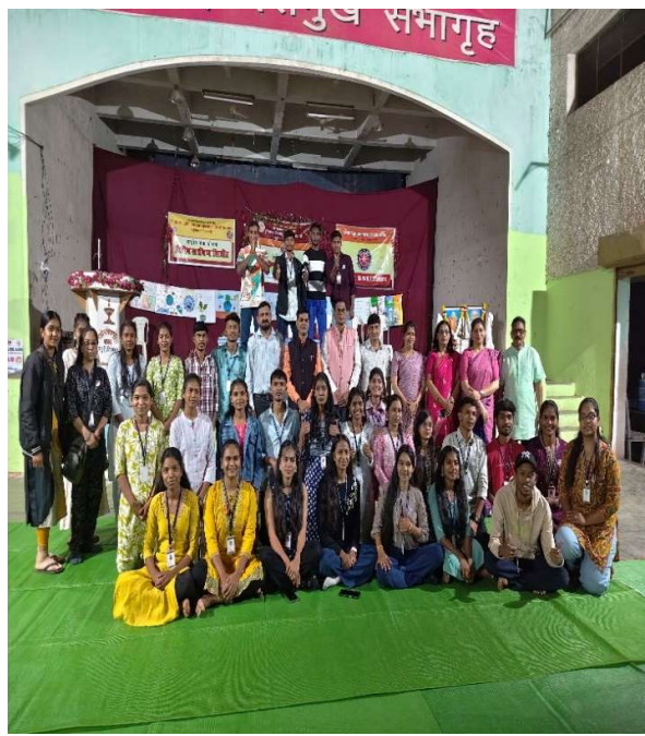
ग्रामीण शिबीरातील समारोप कार्यक्रमातील काही क्षणचित्रे