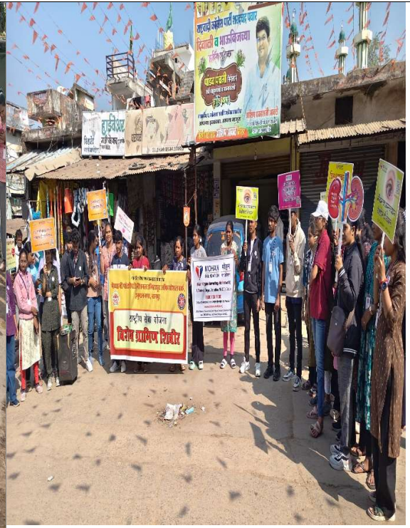
ग्रामीण शिबीरात पथनाट्य करतांना विद्यार्थी