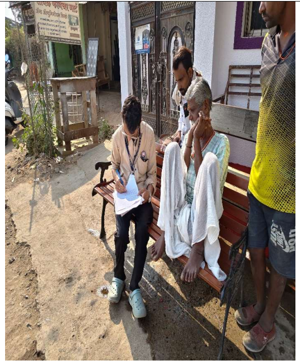
ग्रामीण शिबीरात गावातील सर्वेक्षण करतांना विद्यार्थी