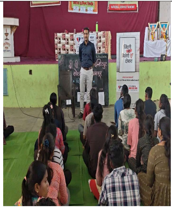
ग्रामीण शिबीरात अवयव दान कार्यक्रमाचा लाभ घेतांना विद्यार्थी